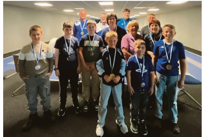
Herzlichen Glückwunsch an alle Platzierten

Hier ein Foto vieler unserer Platzierten der Vereinsmeisterschaft.