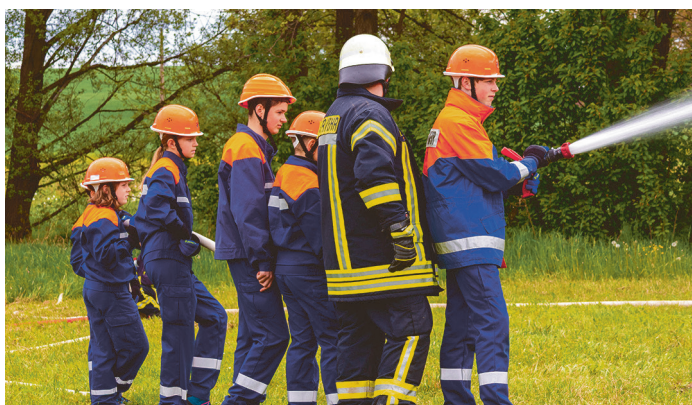
Mit kameradschaftlichem Gruß, Jugendfeuerwehr Hochkirch