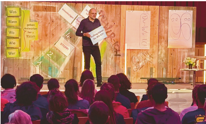
Zwischen den schriftlichen Prüfungen wurde das Ballhaus „mal eben“ für unser Elternseminar zur Bühne umgebaut - mit SAM gelingt Kommunikation noch besser.